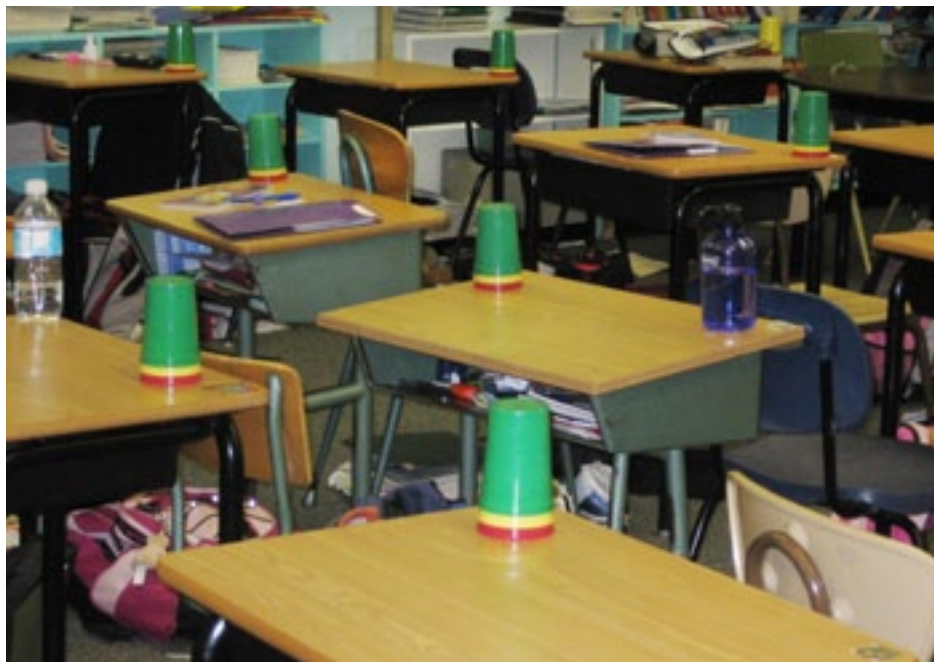
McLeod skola i Edmonton.

som genomförs efter en genomgång eller under arbete med en uppgift. Färgerna kan även användas i form av checklistor eller vid självvärdering. 87